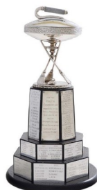
Royal Montréal Colts