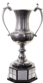
Coupe des Dames